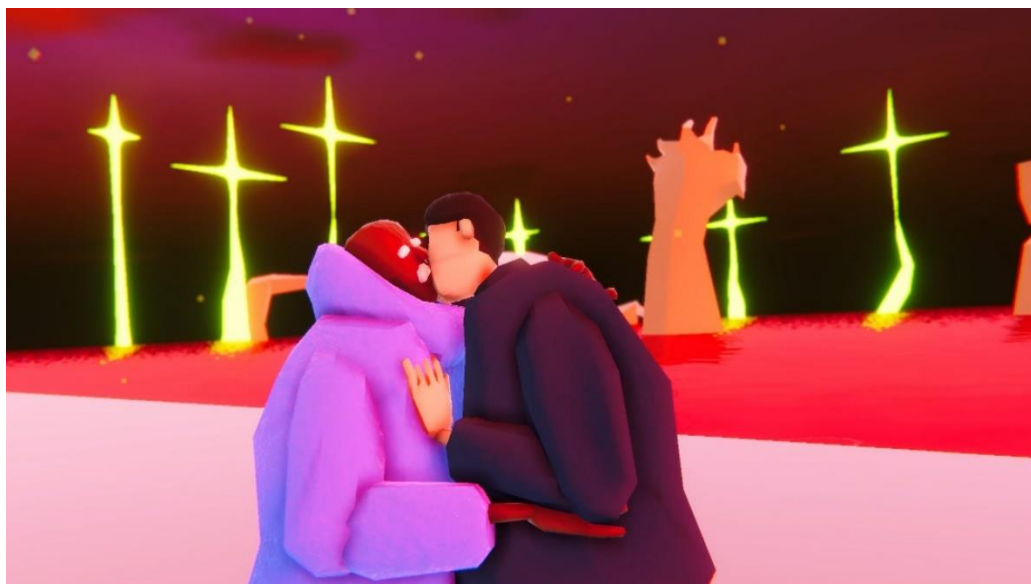
Queer Man Peering Into A Rock Pool.jpg

À travers la métaphore d'un monde balayé par une catastrophe, le jeu interroge notre rapport à la mémoire des êtres chers. Dans un contraste troublant entre l'insouciance de notre avatar et le drame qu'il semble rejouer un peu plus chaque jour, le jeu nous invite à reconstruire ce passé flou mais bien présent. Dans une esthétique vaporwave, mouvement artistique inspiré des débuts d'Internet, le duo Fuzzy Ghost, issu du monde du cinéma et de l'animation, nous offre une expérience touchante et délicate de l'amour qui perdure même lorsqu'il n'est plus là.