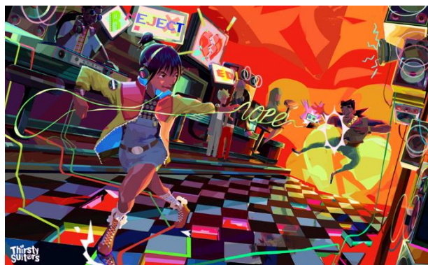
Thirsty Suitors

De retour dans la banlieue américaine de son enfance, Jala va devoir renouer avec ses anciennes amours et amitiés, mais aussi tenter de renouer avec ses parents et sa famille. Basé sur un scénario qui rappelle le cinéma indépendant américain, Thirsty Suitors raconte une histoire dont les personnages principaux sont originaires d'Asie du Sud, et la transcende par son dynamisme. Derrière son énergie, le jeu pose un regard subtil sur les liens familiaux et amoureux, montrant comment la cuisine peut rapprocher les gens et leur permettre de partager leurs émotions.