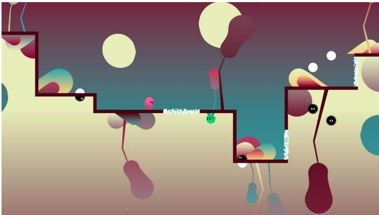
ibb & obb © Richard Boeser