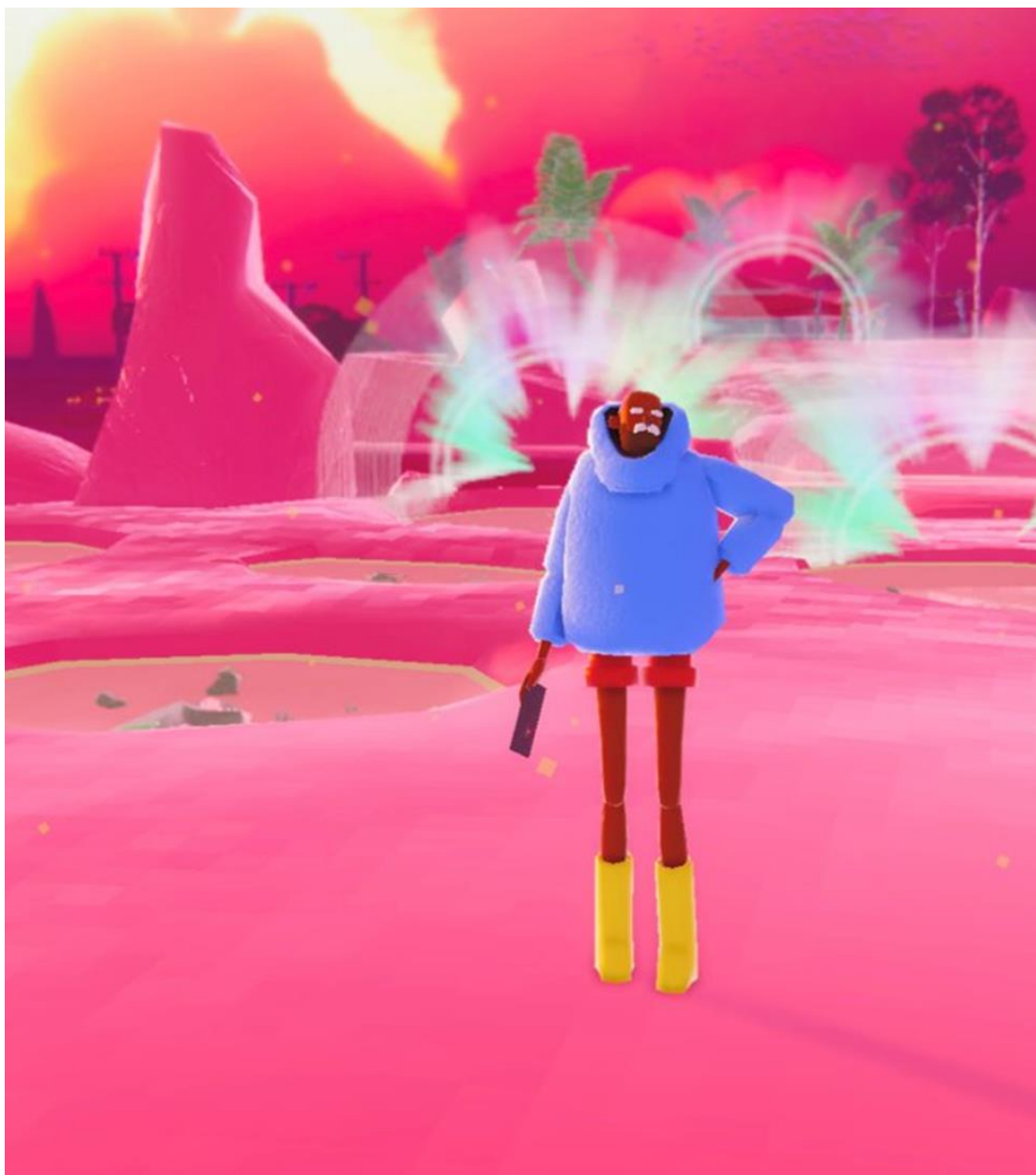
Queer Man Peering Into A Rock Pool.jpg