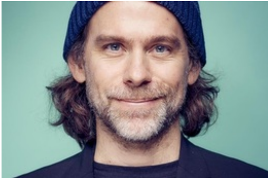
Bryce Dessner

Les concerts de l' Avishai Cohen Quartet sont à chaque fois une expérience unique. Du jazz de très haut niveau ! Le travail du trompettiste et compositeur Avishai Cohen a de nombreux points d'accroche : du jazz créatif moderne au klezmer, en passant par le post-bop et l'improvisation d'avant-garde. Bozar est fier d'accueillir son savoir-faire musical, sa virtuosité et sa sonorité unique.