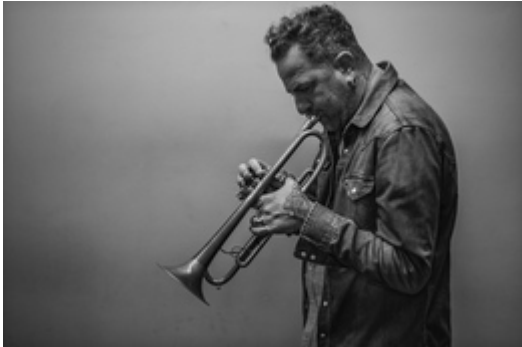
Avishai Cohen

Thurston Moore est l'un des grands noms du rock alternatif. Il est entré dans l'histoire avec le groupe culte Sonic Youth et se fraye depuis des décennies un chemin unique à travers les scènes indie, avant-garde, noise et punk. Hamid Drake est devenu l'un des improvisateurs les plus demandés. Sa polyvalence, alliée au jeu de guitare sans compromis de Thurston Moore, garantira sans aucun doute une expérience musicale d'une intensité inoubliable.