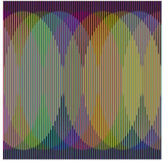
Couleur Additive Pequeña B, Paris 2011 15 x 15 cm

© Carlos Cruz-Diez / Bridgeman Images 2024