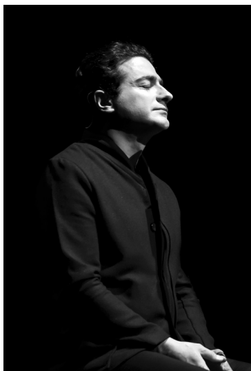
Homayoun Shajarian