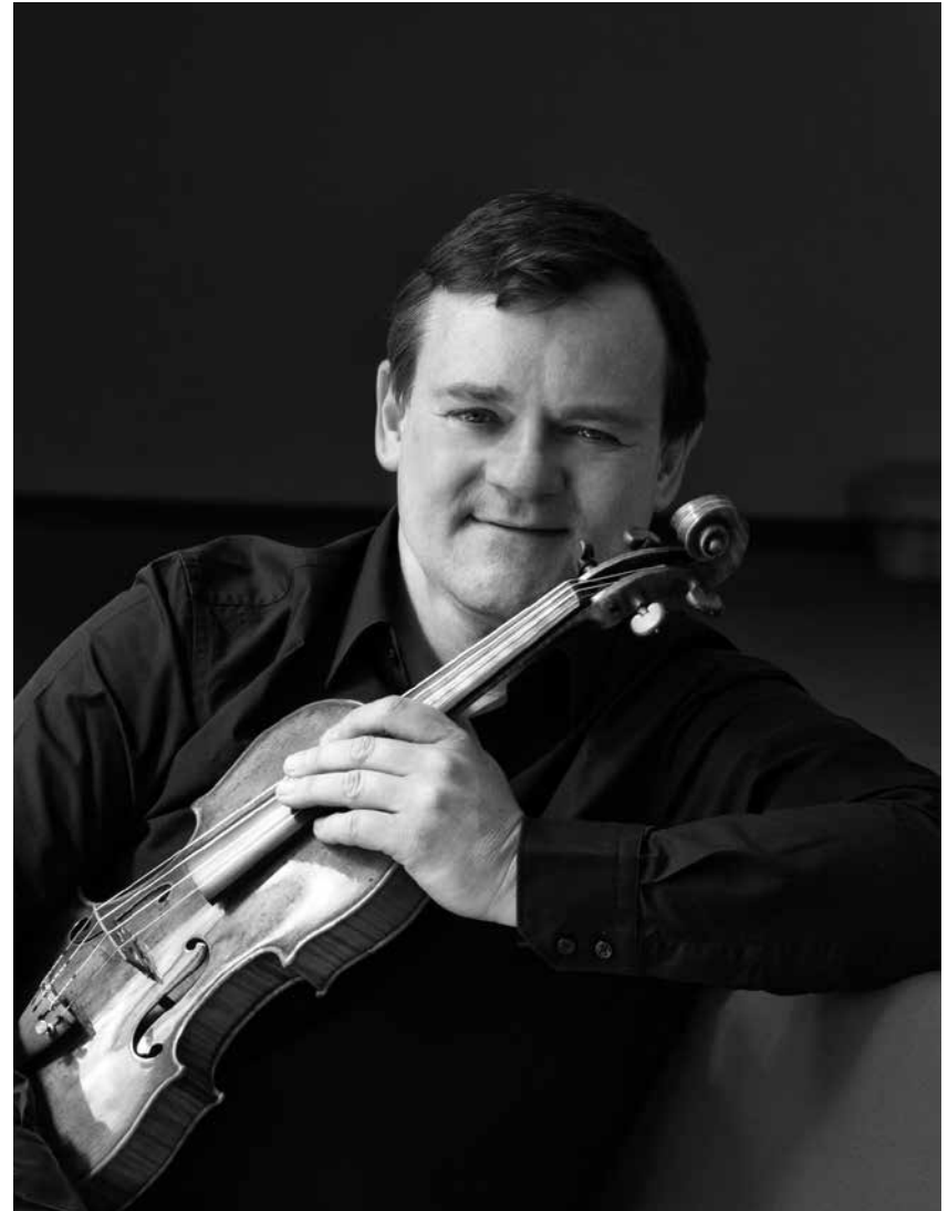
Frank Peter Zimmermann