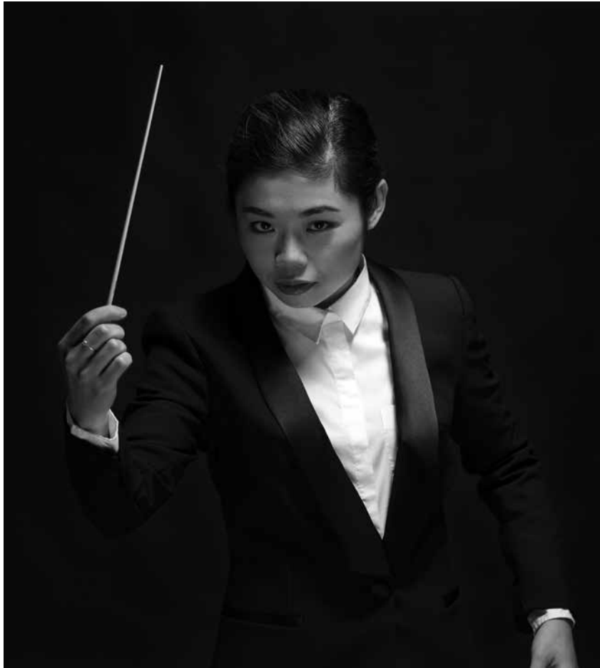
Elim Chan