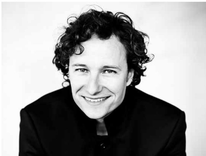
Martin Helmchen