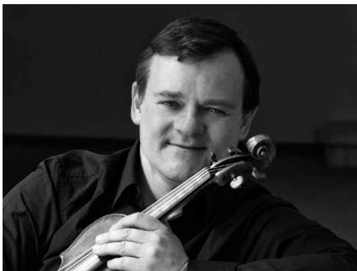
Frank Peter Zimmermann