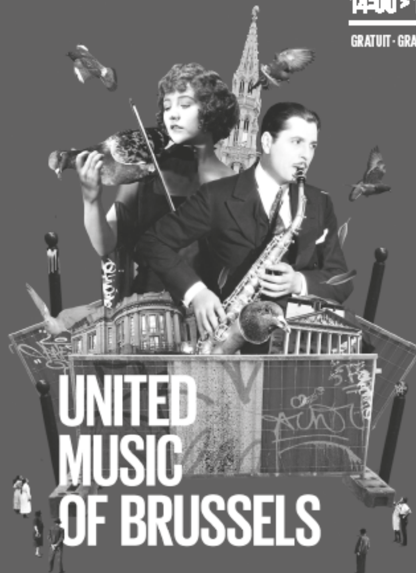
Illustration: J. Van der Vliet