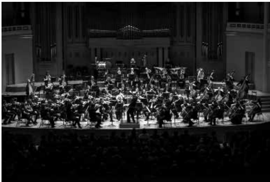
BNO © Veerle Vercauteren