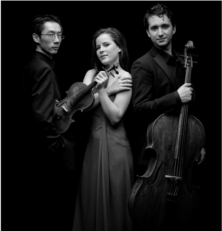
Amatis Trio