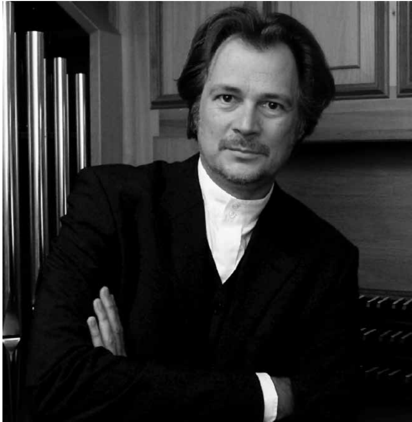
Helmut Deutsch