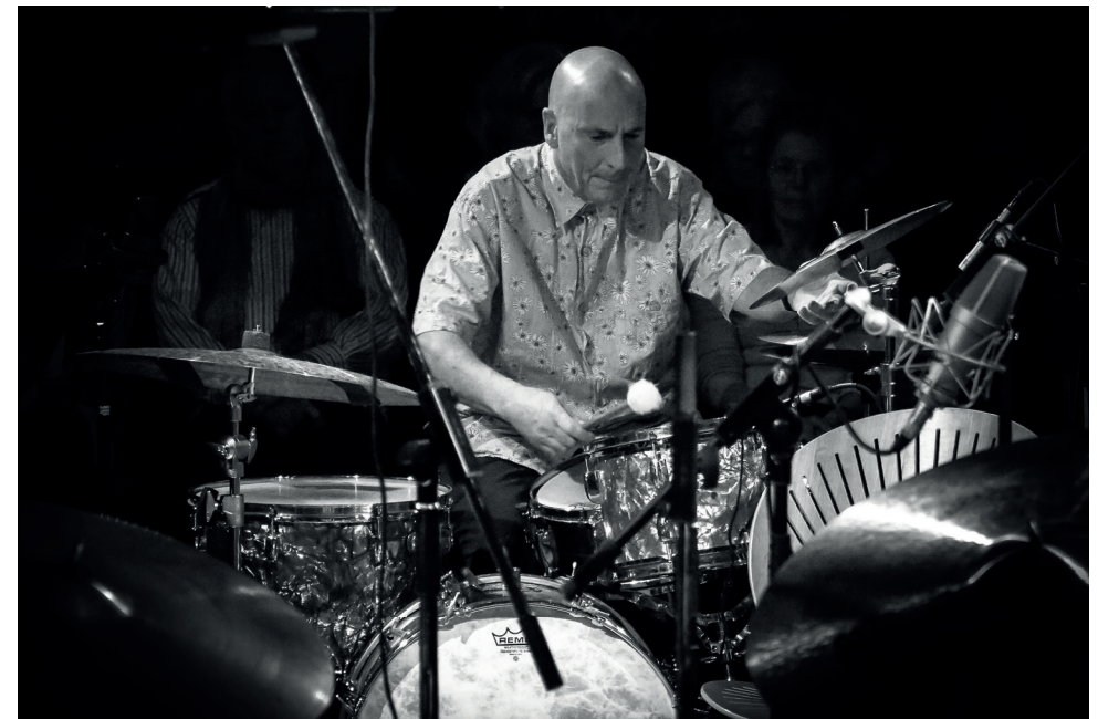
Joey Baron