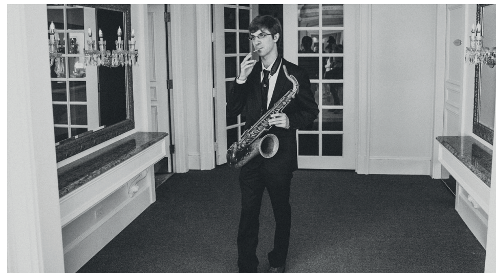
Robin Verheyen © All rights reserved