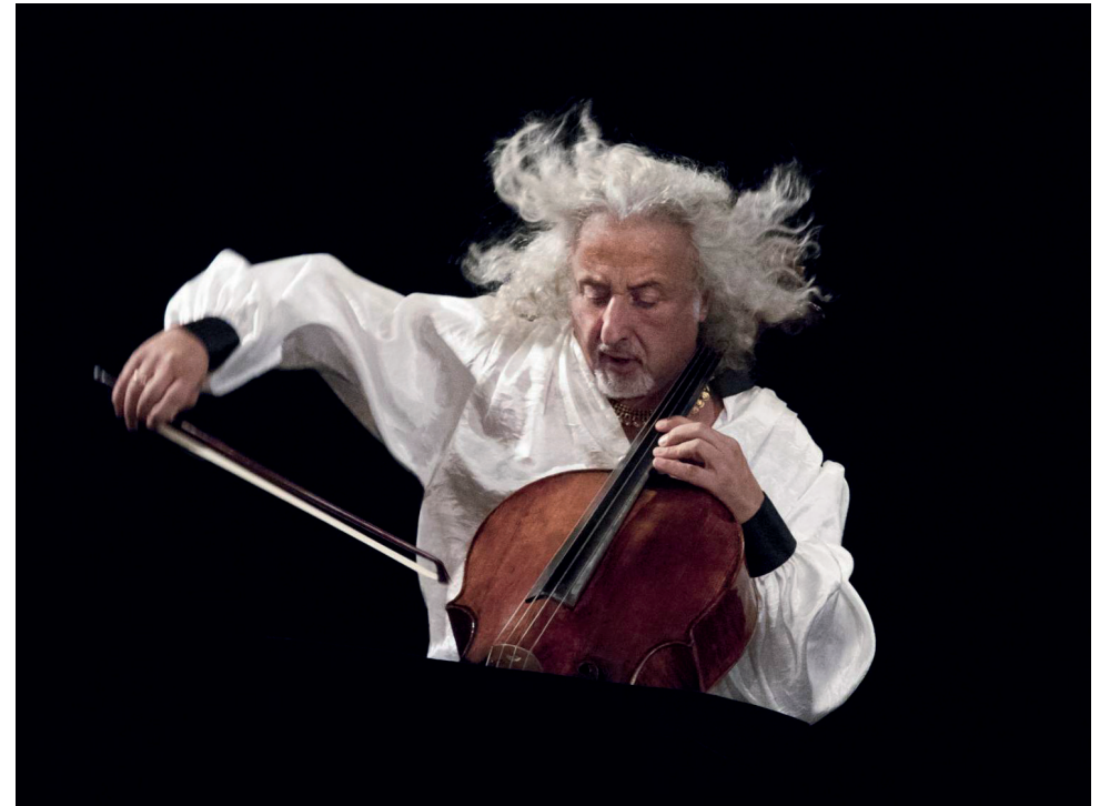
Mischa Maisky