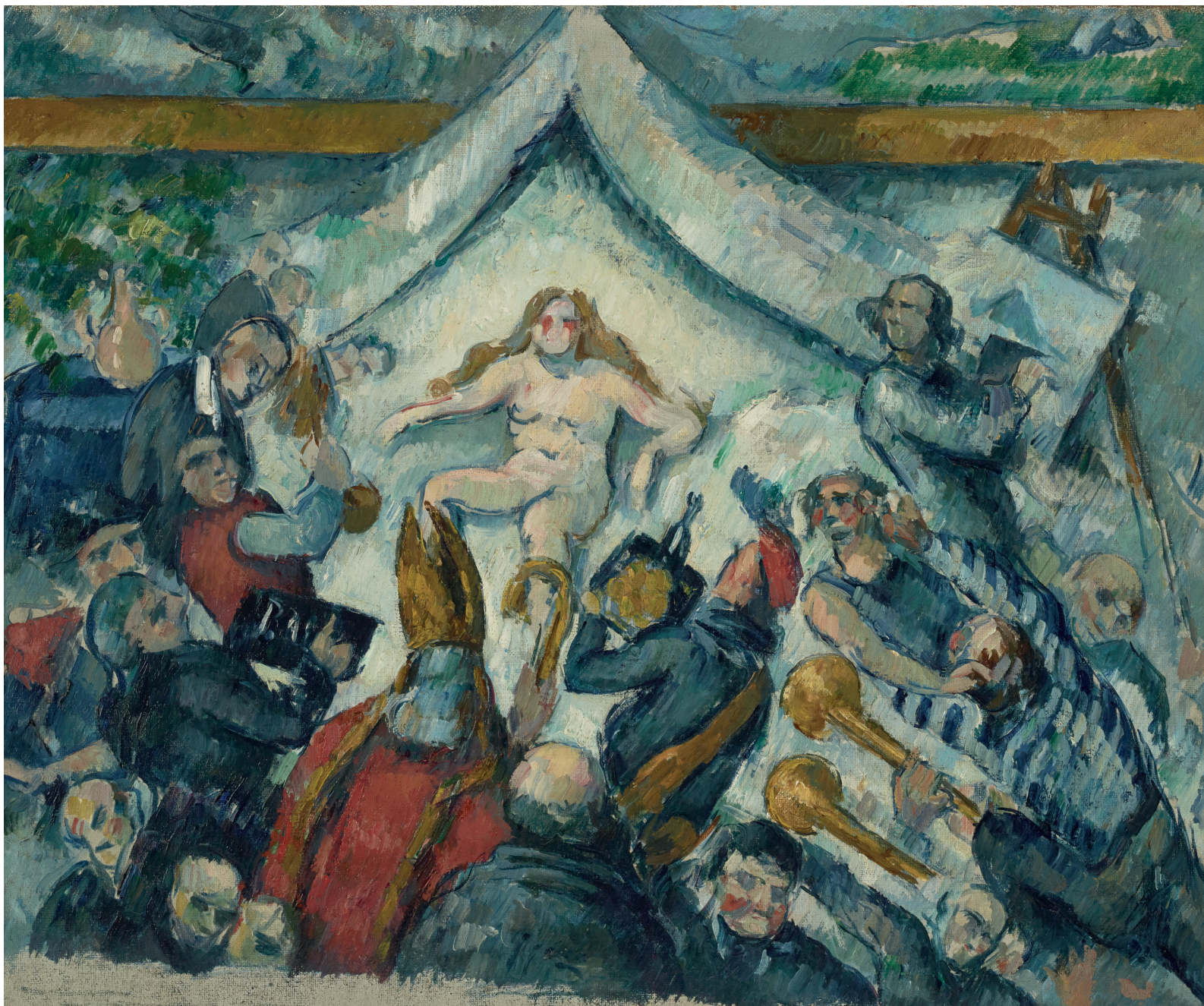
Paul Cézanne, L'Éternel Féminin (1877)

– waaronder ook Mischa Maisky vanavond – spelen namelijk de zogenaamde 'Fitzenhagenversie'. Fitzenhagen was naast een bijzonder onderlegd cellist ook een prima componist en hij heeft het werk er in geen geval minder interessant op gemaakt. Voor Tsjaikovski moet het echter ontzettend frustrerend zijn geweest om te zien hoe zijn werk hem helemaal uit de handen gleed.