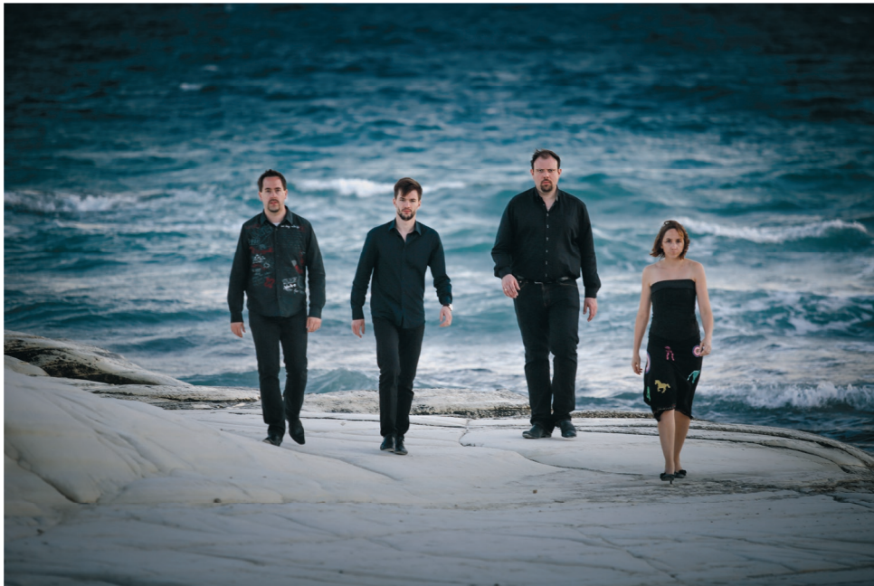
Quatuor Tana