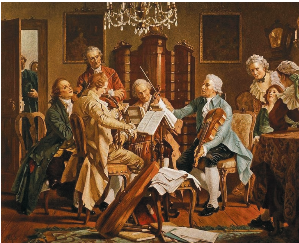
Joseph Haydn playing string quartets, anonymous

religious feelings – he labels all voices with ‘met innigster Empfindung’ – Beethoven also expressed in the Missa Solemnis . In this instance they are placed under the magnifying glass by transferring to the intimate medium of the string quartet which allows them to be conveyed wordlessly. The fact that Beethoven added text to the parts of the Dankgesang in spite of this is a sign of his fear that performers and audience wouldn’t sense the poetic strength of this music. Even though the construction of his compositions is very