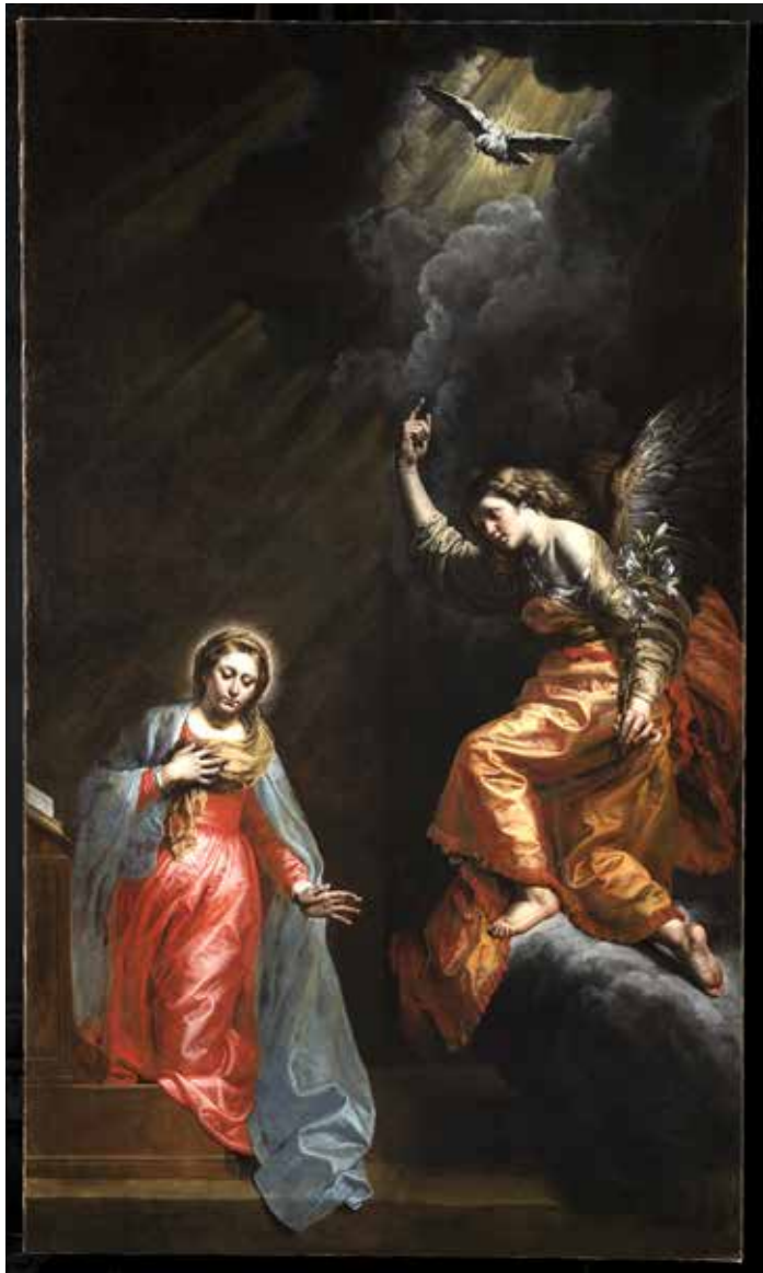
Annunciatie · L'Annonciation, Doek · Huile sur toile, 341,5 x 200 cm, Bruxelles, église Saint-Jean-Baptiste au Béguinage