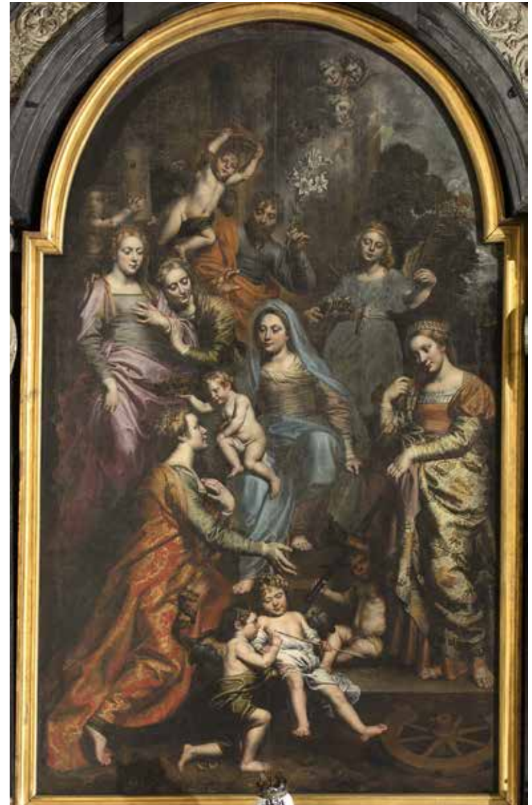
Heilige Ursula gekroond door het Kind Jezus · Le Couronnement de sainte Ursule (Virgo inter virgines) (1626), Bruxelles, église Saint-Jean-Baptiste au Béguinage