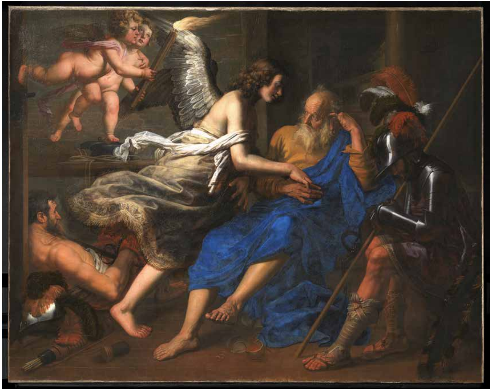
Bevrijding van Petrus - La Délivrance de saint Pierre, Doek · Huile sur toile, 180 x 227 cm, Bruxelles, église Saint-Jean-Baptiste au Béguinage