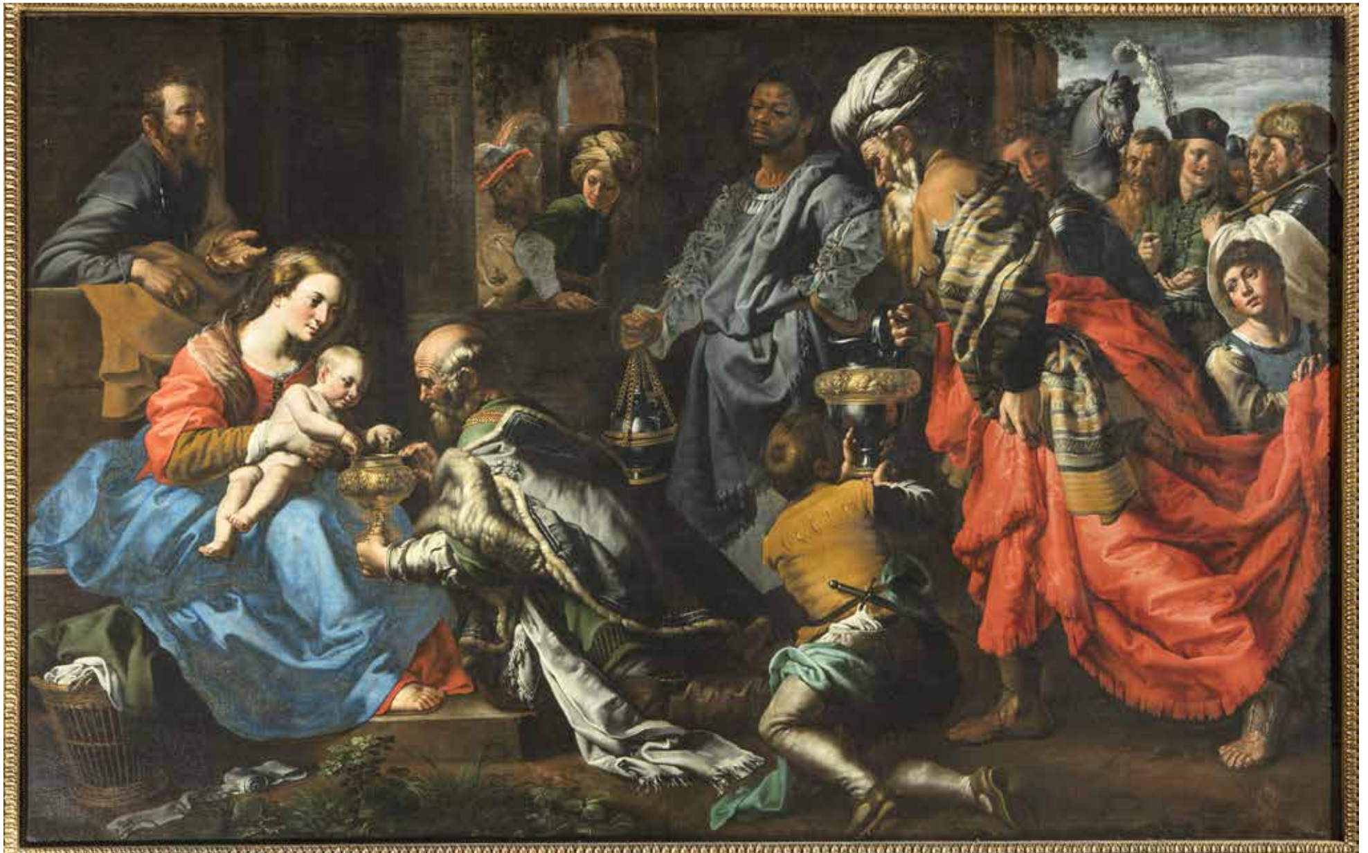
De Aanbidding der Koningen · L'Adoration des mages, Doek · Huile sur toile, 150 x 220 cm, Bruxelles, église Saint-Jean-Baptiste au Béguinage © KIK-IRPA, Bruxelles.