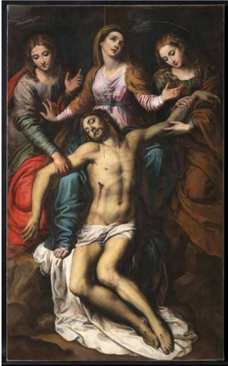
Piëta met Johannes de Evangelist en Maria Magdalena · Pietà avec Jean l'Évangéliste et Marie-Madeleine, naar · d'après Marco Pino da Siena (Siena, 1521 - Napoli, 1583), Doek · Huile sur toile, 205,5 x 126 cm, Bruxelles, église Saint-Jean-Baptiste au Béguinage