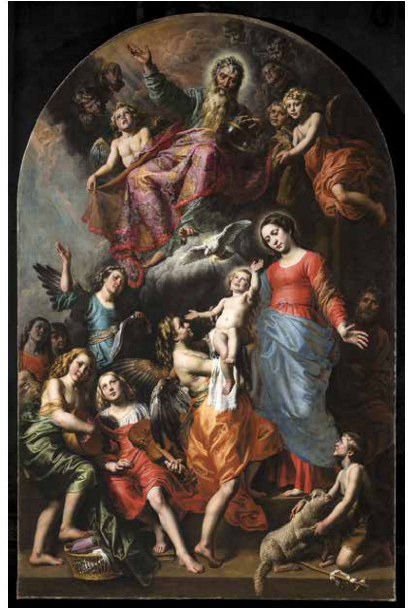
Heilige Drie-eenheid met Maria, Johannes de Doper en engelen · La Sainte trinité avec la Vierge, saint Jean-Baptiste et les anges, Doek · Huile sur toile, 360 x 233 cm, Bruxelles, église Saint-Jean-Baptiste au Béguinage