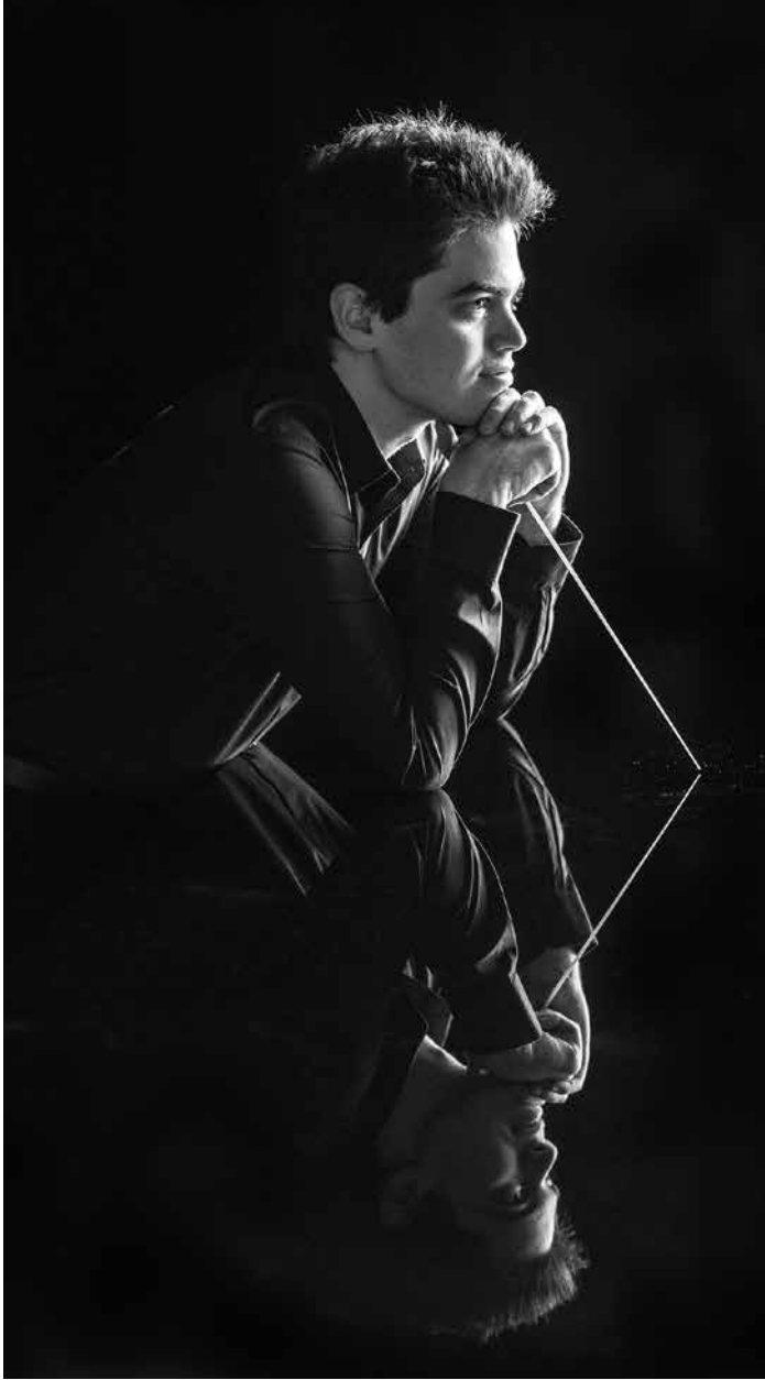
Lahav Shani