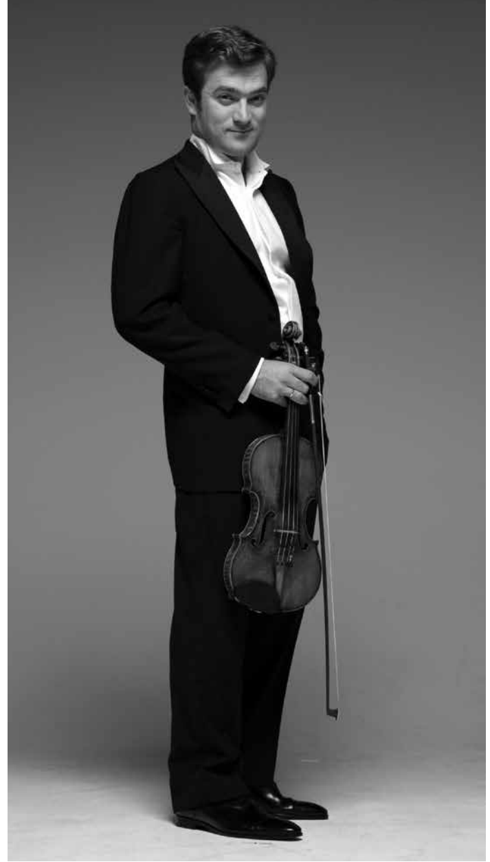
Renaud Capuçon