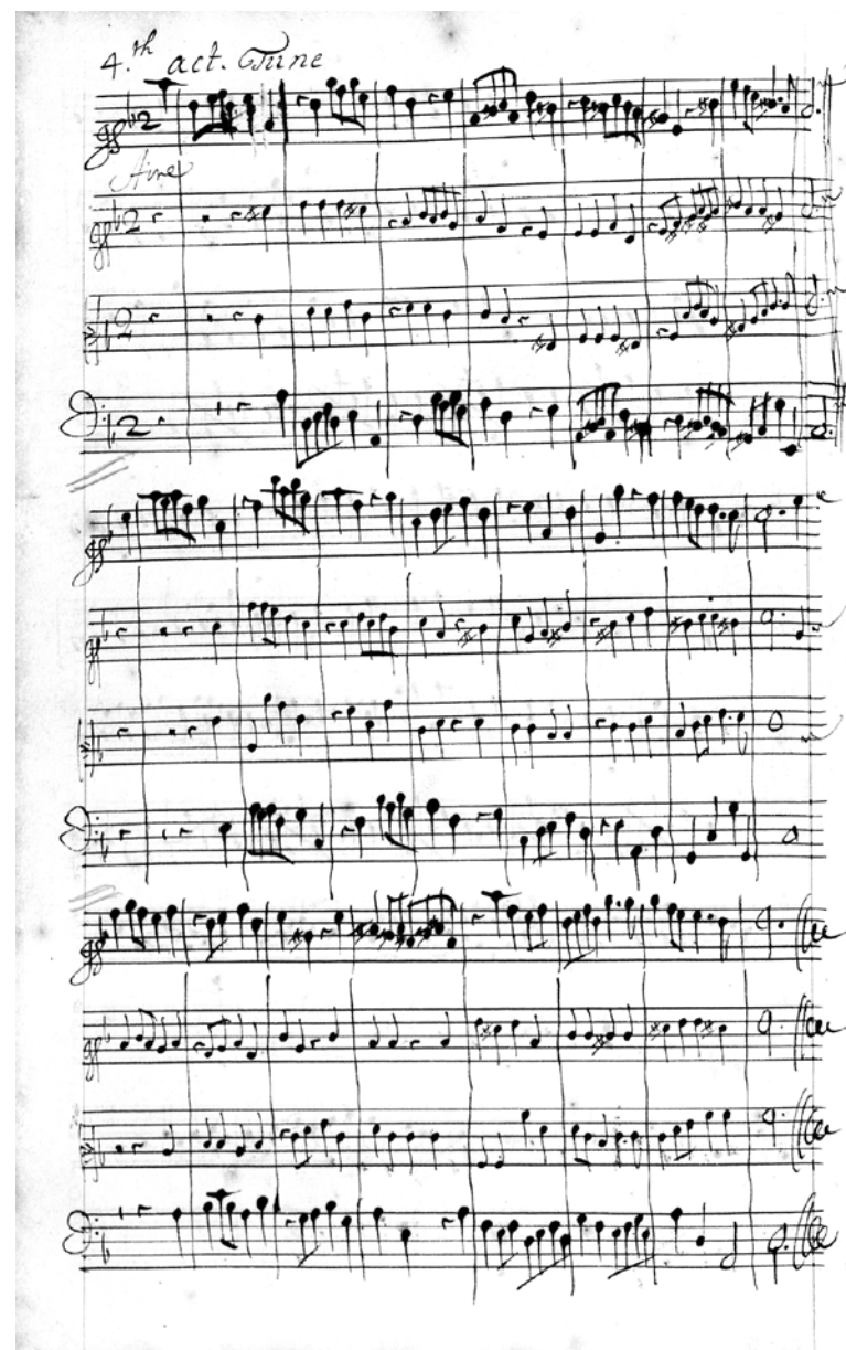
Henry Purcell, The Fairy Queen , manuscript van de partituur · manuscrit de la partition, 1692, "4 th act Tune".

Hertog Theseus organiseert de bruiloft van het Atheense stel. De ambachtslieden kunnen hun tragedie nu eindelijk opvoeren. Het wordt een heuse burlleske, en het feest wordt afgesloten in het bijzijn van Titania en Oberon.