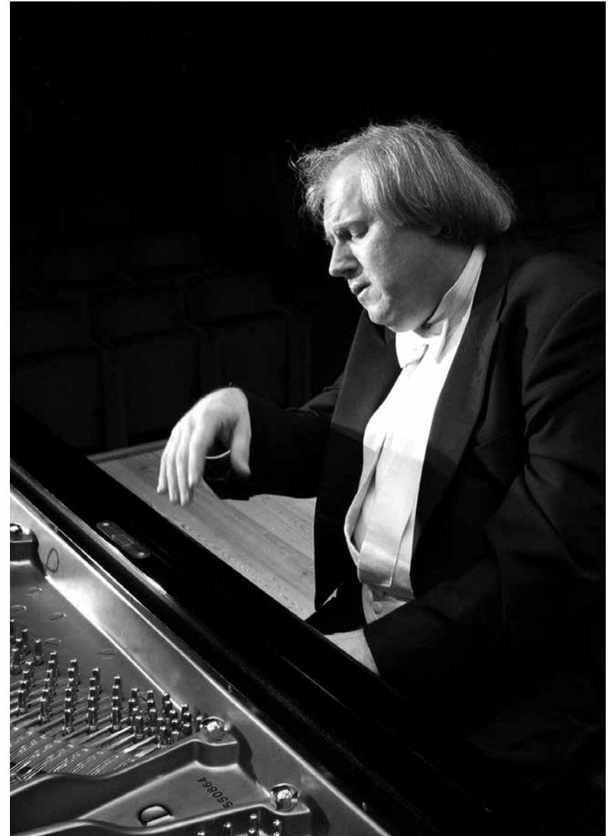
Grigory Sokolov