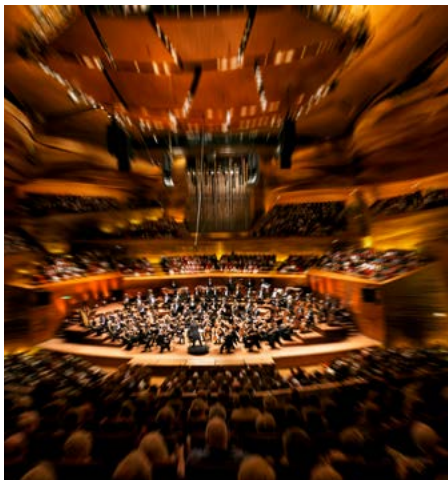
Danish National Symphony Orchestra

Fondé en 1925 au sein de la Danish Broadcast Corporation, le Danish National Symphony Orchestra a pour devise « Le meilleur – et rien que le meilleur ». Réuni sous la baguette de son Chef principal Fabio Luisi, l'orchestre se produit régulièrement aux côtés d'artistes de premier plan, s'imposant comme l'un des orchestres majeurs d'Europe. Au fil du temps, l'orchestre s'est forgé un son unique grâce à la contribution de chefs tels que Fritz Busch, Nicolai Malko, Herbert Blomstedt, Thomas Dausgaard ou encore Rafael Frühbeck de Burgos. Il se consacre au répertoire classique dans sa grande diversité : des œuvres de Beethoven et Brahms à la création contemporaine, en passant par les chefs-d'œuvre romantiques et modernes. Dans ses programmes, il accorde également une place particulière aux grandes figures danoises telles que Carl Nielsen ou Niels W. Gade, mais aussi aux jeunes compositeurs actuels. L'orchestre se produit chaque année devant quelque 100 000 personnes, au sein de la Salle symphonique de Copenhague (DR Koncerthuset) conçue par Jean Nouvel, ainsi que lors de tournées. Ses Concerts du jeudi retransmis sur les chaînes de télévision et de radio danoises et internationales lui permettent aussi de toucher un large public.