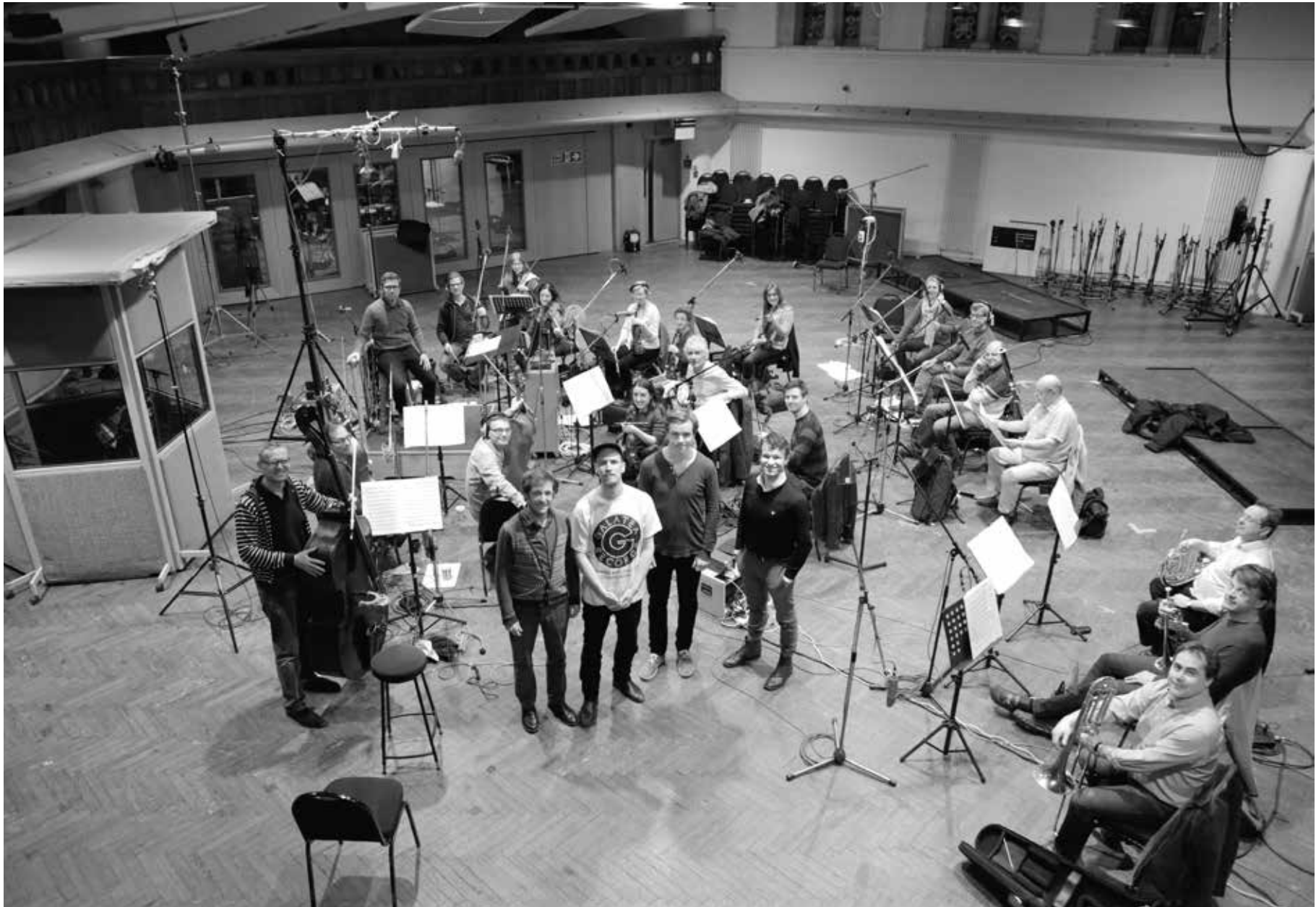
Neset Quartet & London Sinfonietta