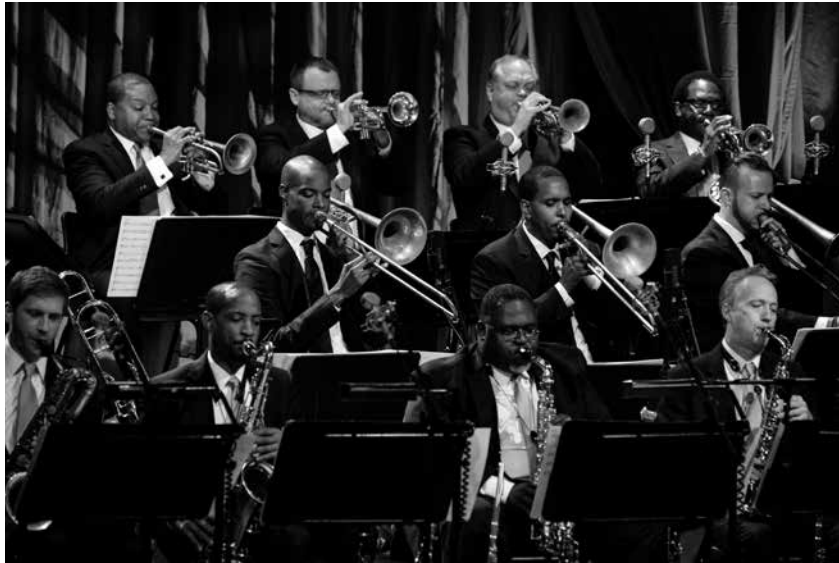
Jazz at Lincoln Center Orchestra