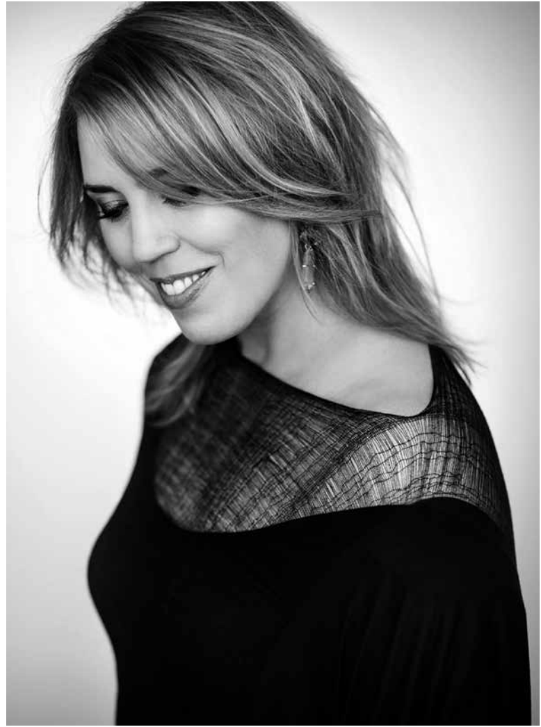
Gabriela Montero