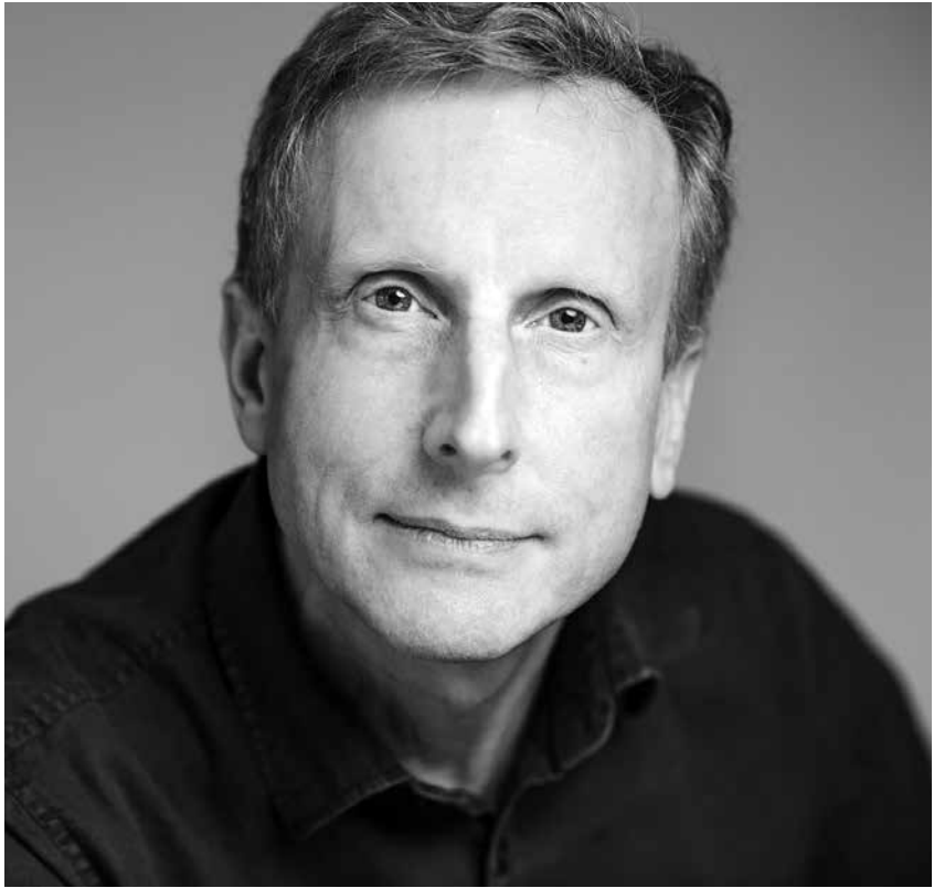
Hugh Wolff