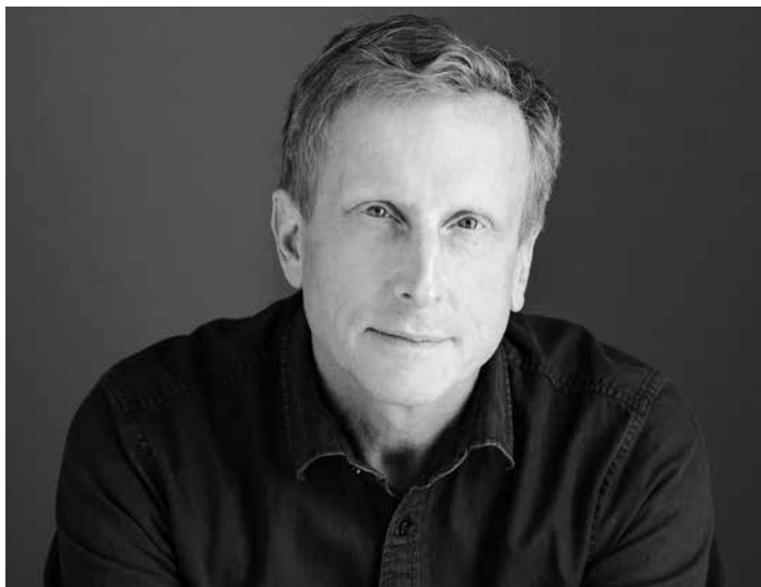
Hugh Wolff