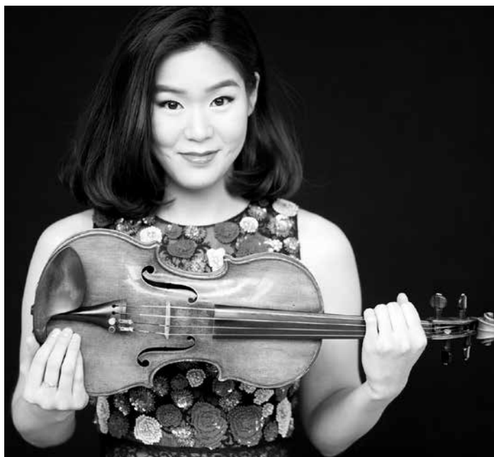
Esther Yoo