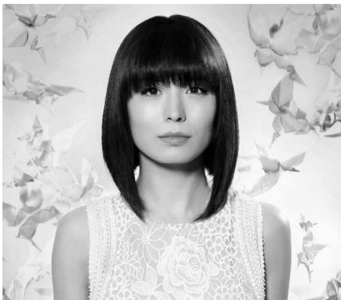
Alice Sara Ott