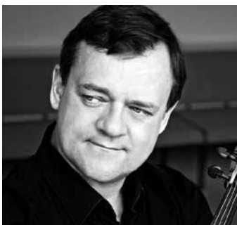
© Irène Zandiel - Hänssler CLASSIC