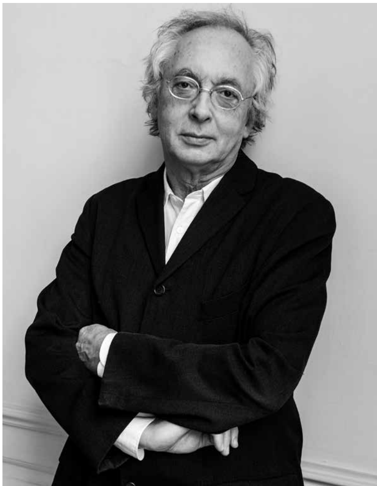
Philippe Herreweghe