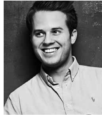
Tobias Feldmann

* Sonatevorm: Klassieke vorm, gebaseerd op de behandeling van twee thema's in drie grote etappes (expositie, doorwerking, re-expositie) binnen een welbepaald tonaal kader.