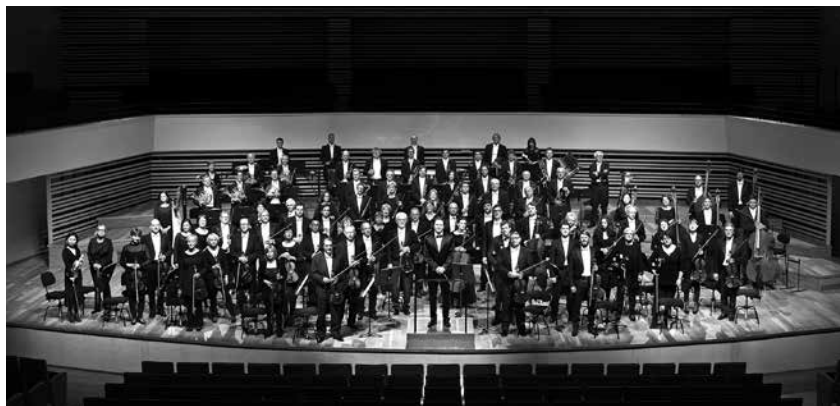
Orchestre National de Lille