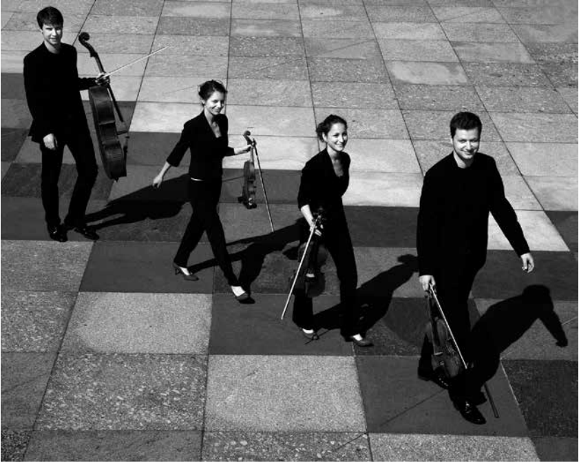
Armida Quartett