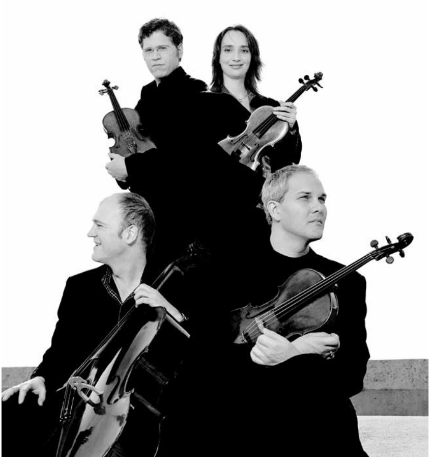
Cuarteto Casals