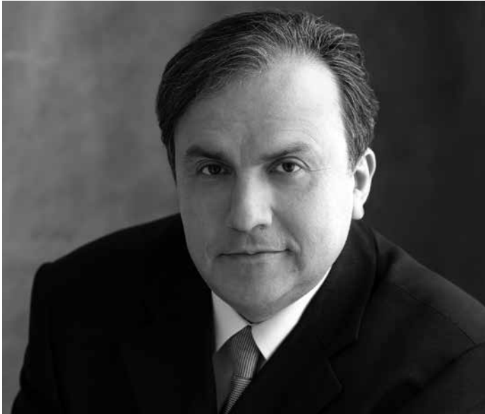
Yefim Bronfman