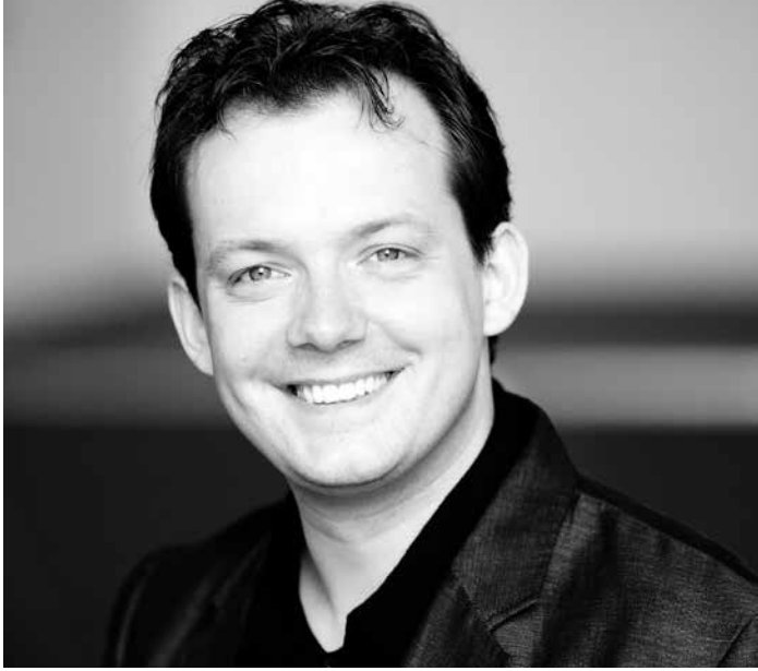
Andris Nelsons