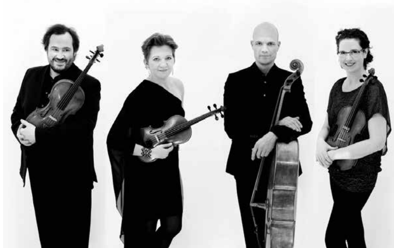
Artemis Quartett

zijn liefde voor Clara, zijn hele oeuvre voor kamermuziek beheersen. Het stuk is ook vandaag nog een voorbeeld van dynamiek en onovertroffen frisheid. In het Pianokwintet tref je de strikte kwartetstijl aan, die Schumann combineert met verbeelding, met de rijkdom en vrijheid van zijn concorderende pianoschriftuur. De vier delen volgen een voorwaartse beweging, ze zetten een krachtige lijn uit die leidt tot de finale. Deze vormt het uiteindelijke doel, het moment waarop de uitwerking van de thema's tot volledig wasdom komt. Deze vormelijke oplossing is zo geslaagd en beantwoordt dermate aan de romantische esthetiek, dat ze tegen het einde van de 19e eeuw overal zou worden nagevolgd. We denken hierbij aan Liszt, Brahms, Dvořák, Tsjajkovski en Franck.