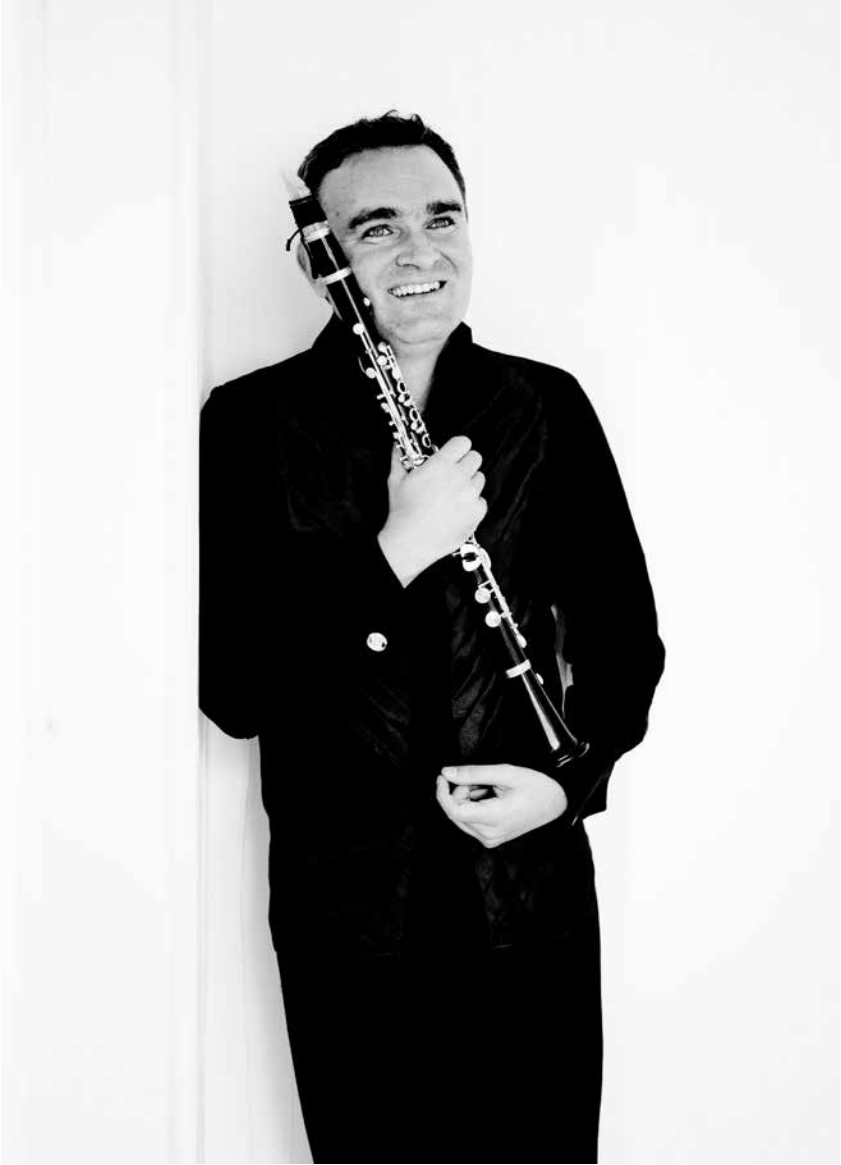
Jörg Widmann