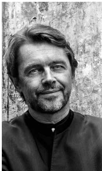
Andrey Boreyko