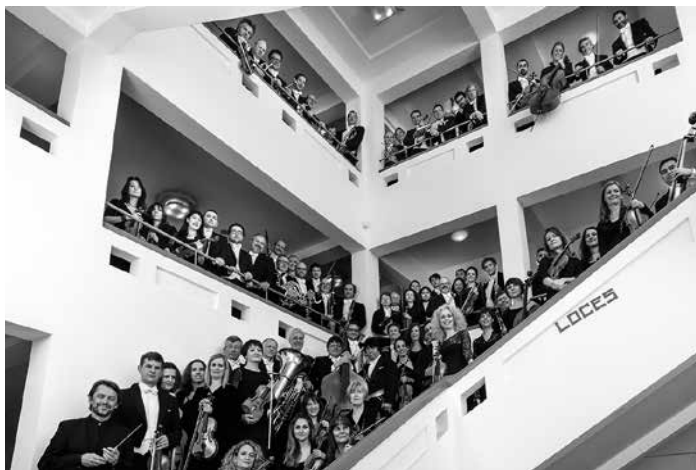
ONB · NOB