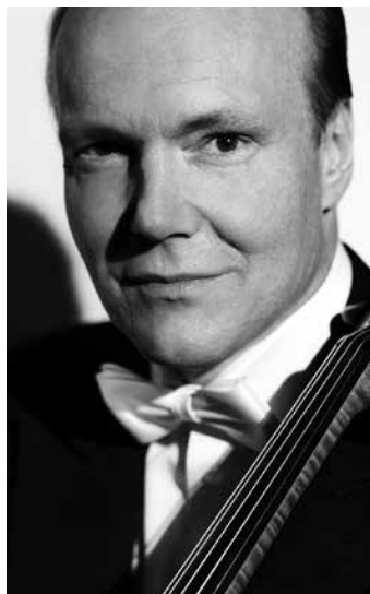
Truls Mørk