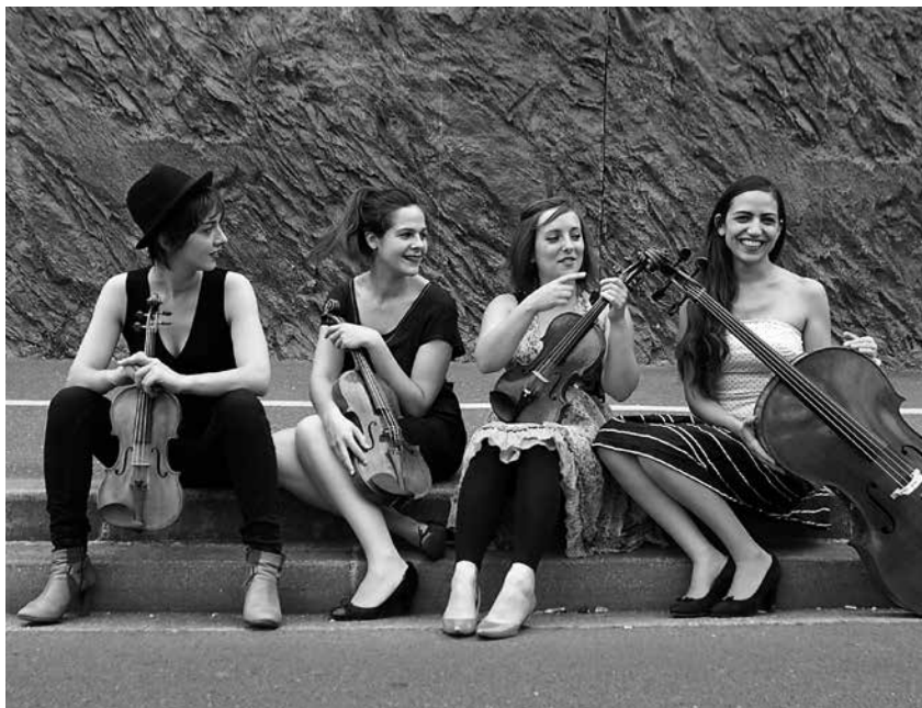
Quatuor Zaïde