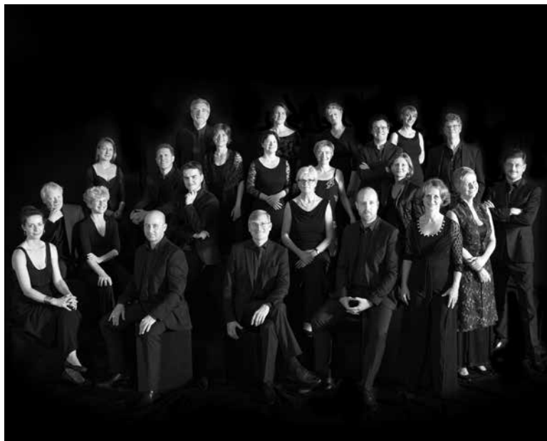
Freiburger Barockorchester