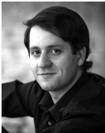
Nikita Mndoyants