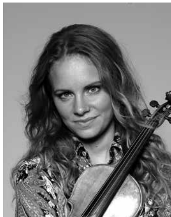
Fischer Julia