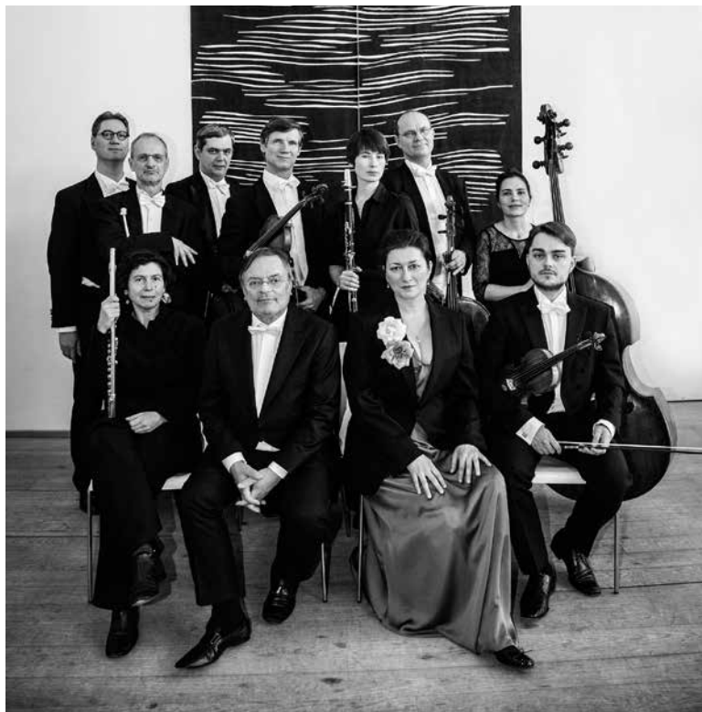
Anima Eterna Brugge